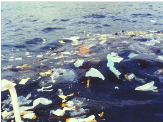
Impacto de flotantes debido a una DSS

Así el nuevo texto, ya permite los desbordamientos de los sistemas de saneamiento en episodios de lluvia, admitiendo que en la práctica no es posible construir sistemas colectores y las instalaciones de tratamiento de manera que se puedan someter a tratamiento la totalidad de las aguas residuales en episodios de lluvia. Pero también admite que estos desbordamientos no pueden producirse en cualquier circunstancia, de manera que se incorporan obligaciones con el objetivo de limitar la contaminación producida por estos desbordamientos.