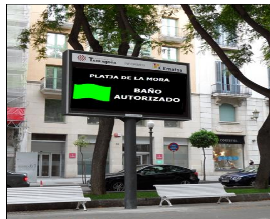
Ejemplo de modelización de DSS en playas