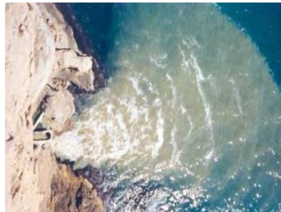
Pluma de contaminación de una DSS