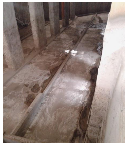
Ejemplo de tanque de tormenta