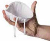
2. Sostenga el respirador de manera que la parte externa esté apoyada en la palma y los elásticos permanezcan por debajo de la mano.