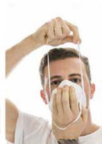
3. Colocar el respirador por debajo del mentón con el clip nasal hacia arriba y colocar el elástico inferior en la nuca.