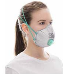
8. En el respirador Zero, los elásticos también pueden posicionarse cruzados si se requiere una mayor tensión