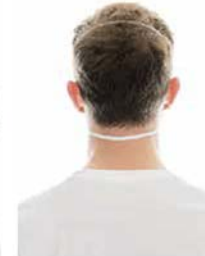
7. Vista trasera.