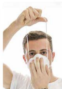
4. Coloque el elástico superior en la parte superior de la cabeza