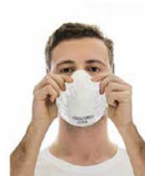
5. Acomode el respirador sobre el rostro y ajuste el clip nasal