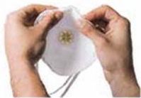
1. Preforme el clip nasal interno.